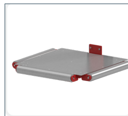
Plateau inox et acier avec rouleaux