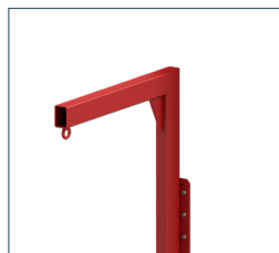
Potence avec anneau