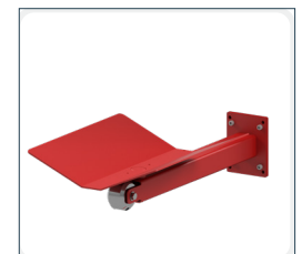
Plateau en V